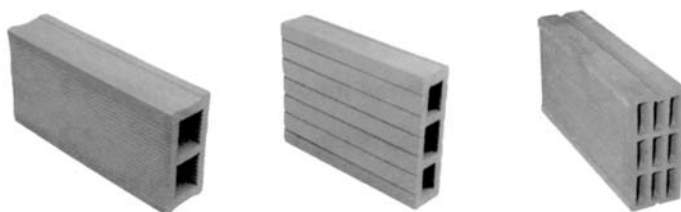
Příčkovky podélně děrované