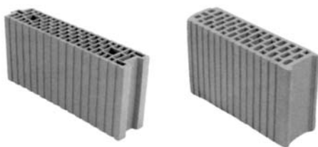
Příčkovky svisle děrované